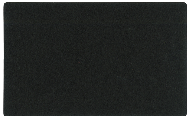
▲ 7 (ブラック)