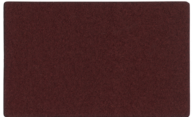
▲ 1 (マロンエンジ)