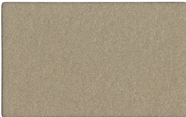
▲ 2 (アイボリー)