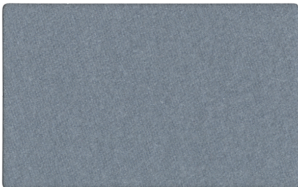
▲ 3 (グレー)